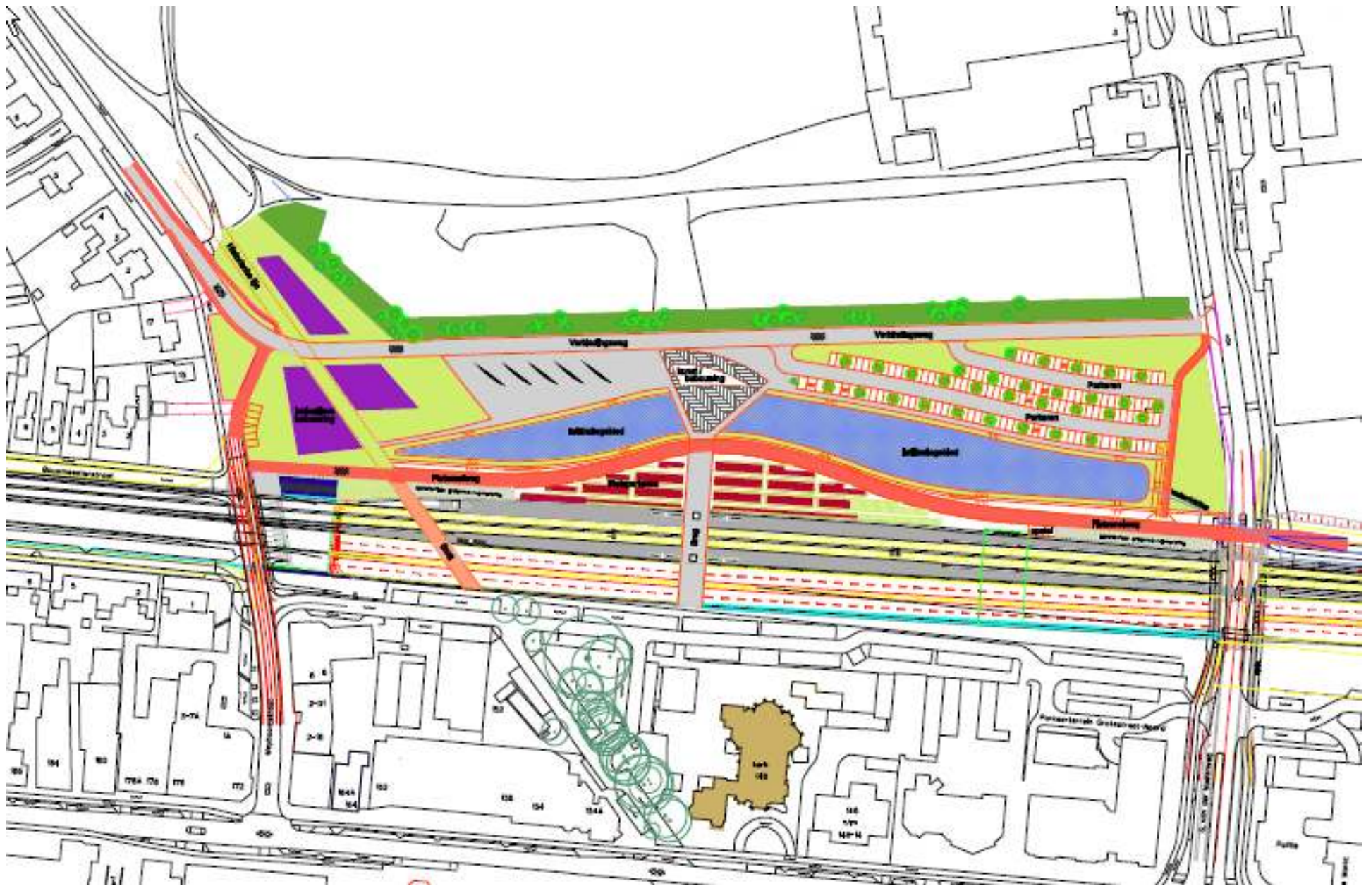
Juli 2010, schetsontwerp met doorgetrokken brug